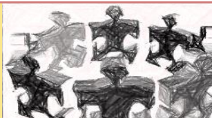
TAVOLA ROTONDA 1