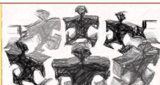
TAVOLA ROTONDA 2